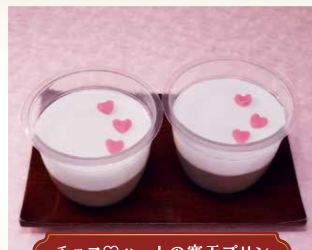
チョコ♡ハートの寒天プリン