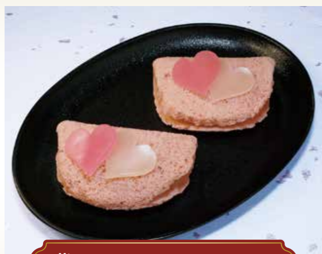
苺とミルクのスイートハート