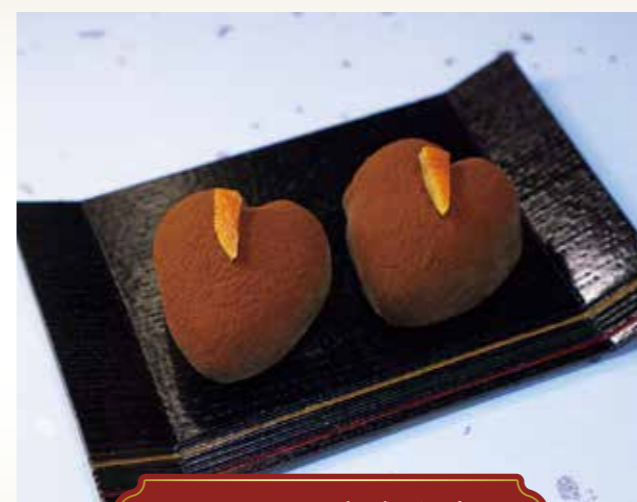
チョコのささやき